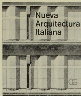
NUEVA ARQUITECTURA ITALIANA ALBERTO GALIARDI EDITORIAL GUSTAVO GILI

—La dramática lucha de los arquitectos italianos actuales por liberarse del peso del historicismo y su búsqueda de un lenguaje espacial y formal auténticamente contemporáneo, se destaca con relieves especiales en el panorama de la arquitectura europea de este siglo.