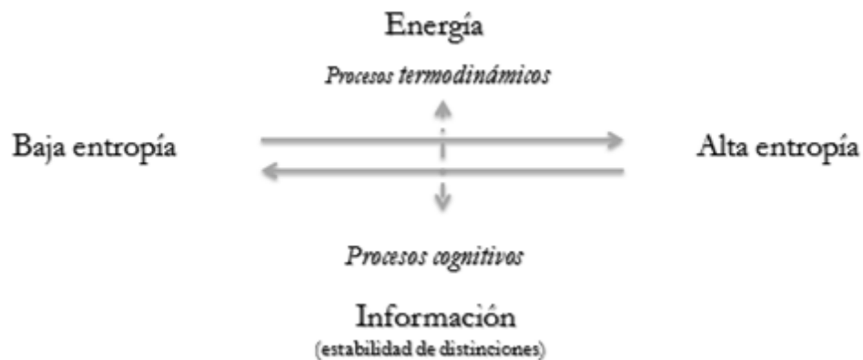
Figura 3. Modelo que integra, pero a la vez confunde y reduce el dominio cognitivo al termodinámico.

Si todo proceso explicativo es tautológico en algún nivel (Bateson 1972), toda generación de sentido responde a lógicas autorreferenciales, dando forma en el dominio cultural, a tramas de tramas recursivas de distinciones que se coproducen y estabilizan unas a otras en un sistema de observadores. De este modo, lo que llamamos eco-organización es quizás, sólo la expansión y manifestación de los procesos de auto-organización en un contexto de observación de mayor escala. Es decir, lo que aparece como entorno de un sistema cognitivo a cierto nivel de observación, puede transformarse desde un meta punto de vista, en parte constitutiva de la dinámica autorreferencial de dicho sistema. En tal sentido, la distinción entre observador-observado es solo un dualismo válido a un nivel local de interpretación, dado que ambos dominios configuran un proceso cibernético de mayor alcance, a lo que von Foerster (1974) denomina cibernética de segundo orden o cibernética de la cibernética.